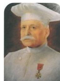
Fondation Auguste Escoffier Villeneuve-Loubet village